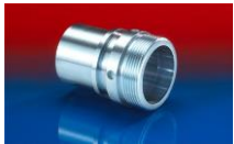
CONNECT THREAD FITTING 234