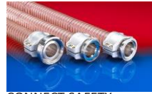
CONNECT SAFETY CLAMP ASSEMBLY 231