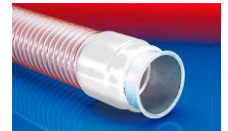
CONNECT 243 FOOD