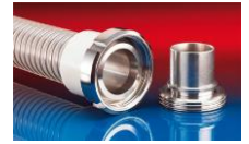
CONNECT MOULD ASSEMBLY 233