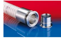
CONNECT PRESS ASSEMBLY 232