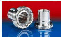
CONNECT DAIRY FITTING 247