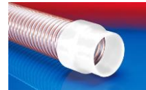
CONNECT 240 + 241 FOOD